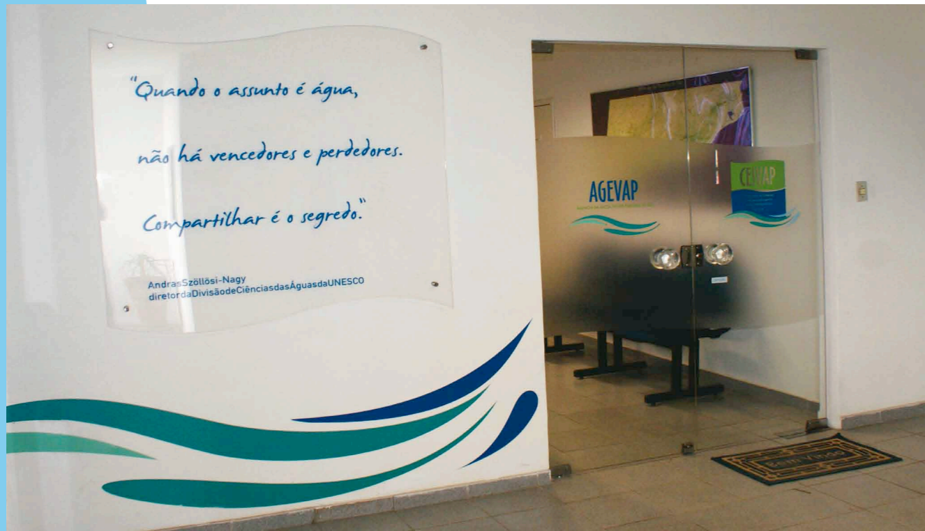
Sede da AGEVAP em Resende (RJ)

A gestão integrada da Bacia Hidrográfica do Rio Paraíba do Sul é o principal objetivo do Sistema CEIVAP/AGEVAP. Desde a criação do Comitê, em 1997, e a implantação da Agência da Bacia, em 2003, todos os esforços têm sido orientados para que as ações sejam realizadas em prol da preservação e recuperação da quantidade e qualidade da água. Recentemente, mais um passo nessa direção foi alcançado com a assinatura de mais dois contratos de gestão entre a AGEVAP e o Instituto Estadual do Ambiente (INEA), para atender a cinco Comitês de Bacias no Estado do Rio de Janeiro.