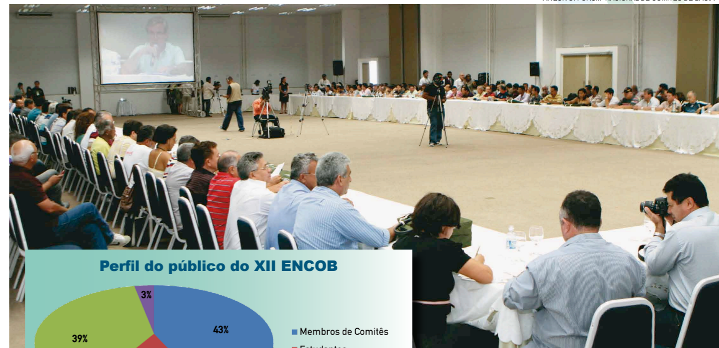
Perfil do público do XII ENCOB

ARQUIVO: FÓRUM NACIONAL DE COMITÊS DE BACIA