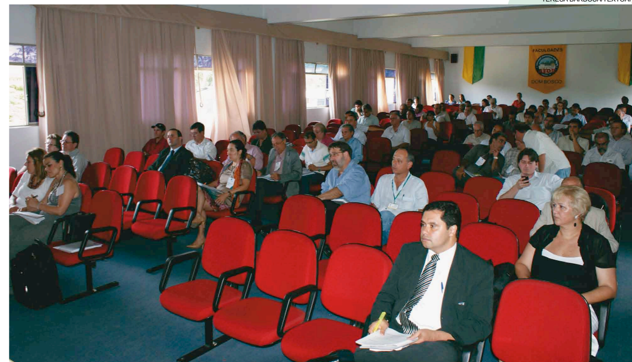
Plenário discutiu critérios de hierarquização de projetos, calendário, eleições, entre outros assuntos