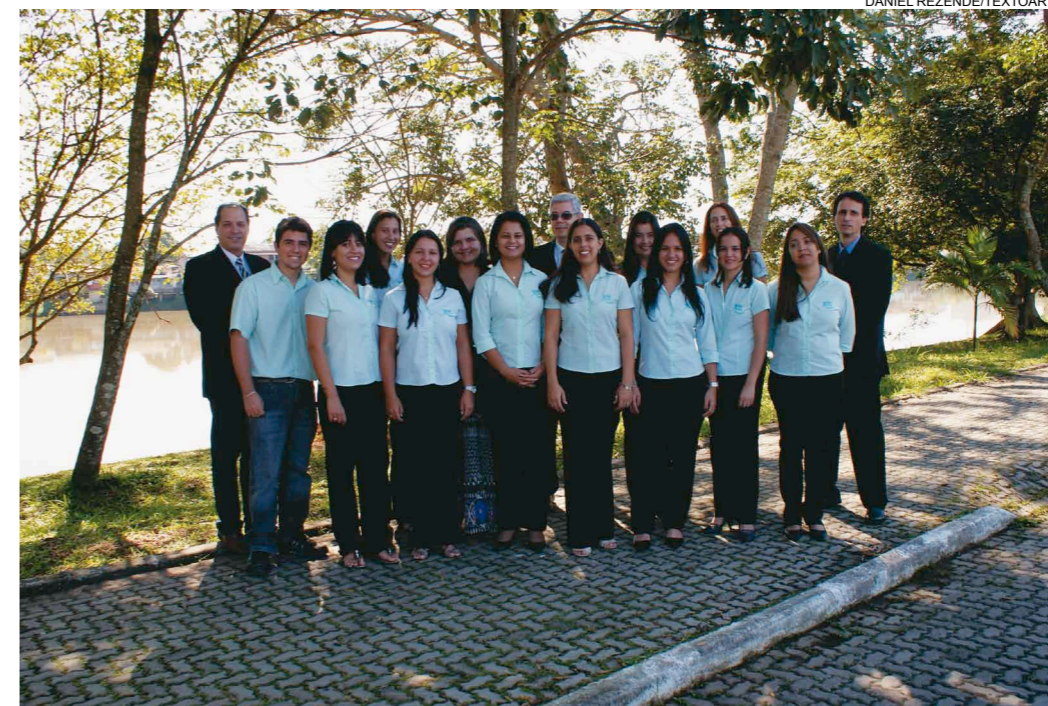
A equipe da Agência da Bacia, que atualmente é formada por 7 funcionários, 12 estagiários e 2 colaboradores, contará com mais 33 profissionais em janeiro. Com o apoio do INEA, Unidades Descentralizadas serão instaladas nas cidades fluminenses de Volta Redonda, Nova Friburgo, Petrópolis, Campos dos Goytacazes, Itaiva e Seropédica