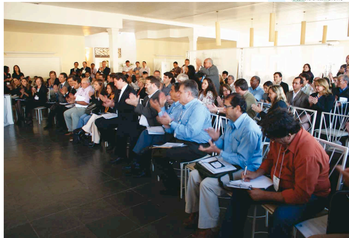
Cerimônia de posse dos novos membros do CEIVAP ocorreu no Salão Lena Buffet, na cidade de Resende (RJ). Evento também comemorou os 15 anos de instalação do Comitê de Integração, completados no dia 22 de março

Tomaram posse no dia 24 de maio os novos membros do Comitê de Integração da Bacia Hidrográfica do Rio Paraíba do Sul (CEIVAP). A atual formação do colegiado – com representantes do Governo Federal e dos três Estados da bacia (São Paulo, Rio de Janeiro e Minas Gerais) – foi eleita para o biênio 2011-2013. A cerimônia aconteceu durante a 1ª Reunião Extraordinária do Comitê, realizada em Resende (RJ), oportunidade em que também foram comemorados os 15 anos de instalação do CEIVAP.