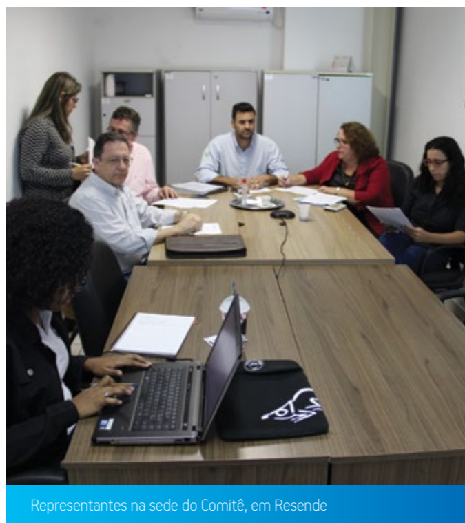
Representantes na sede do Comitê, em Resende

A Superintendência de Gestão de Projetos Especiais da Sabesp informou sobre o andamento dos testes da interligação Jaguari-Atibainha. A ANA, por sua vez, apresentou um relato da última reunião do Grupo de Assessoramento à Operação do Sistema Hidráulico Paraíba do Sul (GAOPS), realizada no dia 4 de junho.